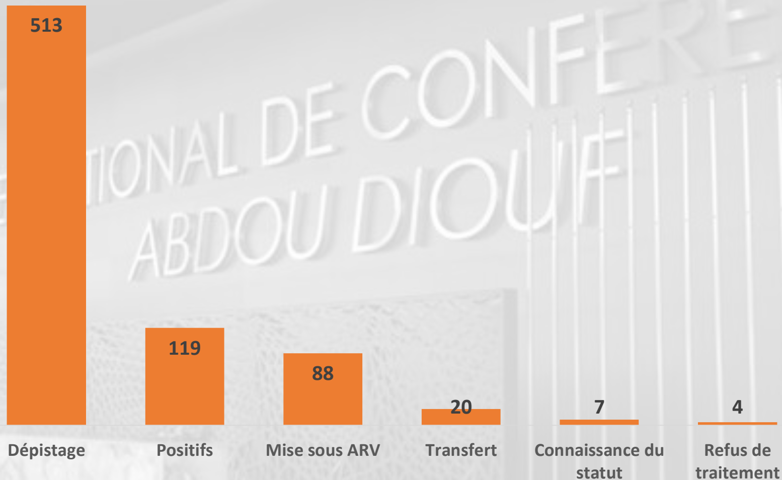
Figure 1: Dépistage et mise sous traitement